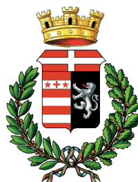
Comune di Gressoney Saint-Jean

La seconda stagione di “Monterosa racconta” presenta grandi narratori della scena letteraria contemporanea e approfondisce i temi della nostra attualità.