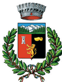
Comune di Ayas